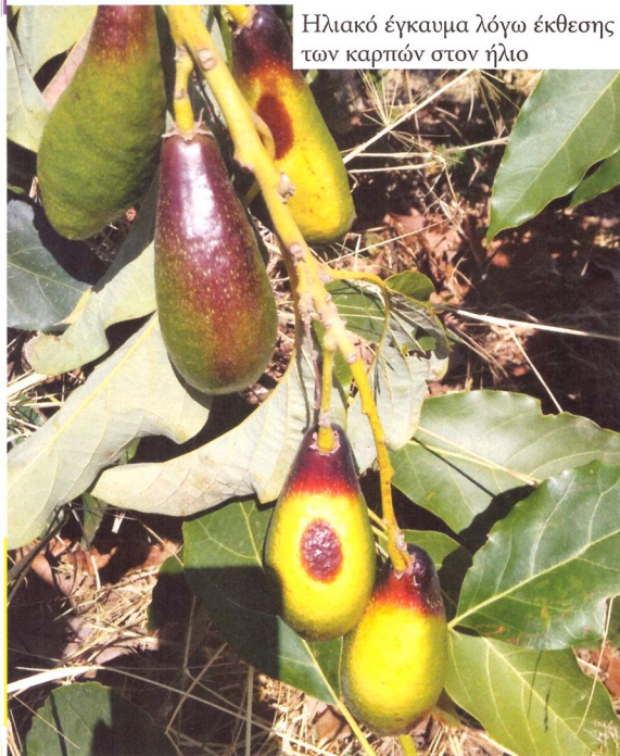
Ηλιακό έγκαυμα λόγω έκθεσης των καρπών στον ήλιο